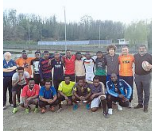
La squadra dei Diavoli Rossi di Varese è composta da rifugiati o richiedenti asilo accolti da tre cooperative. Hanno da 18 a 30 anni e si allenano mercoledì e venerdì in un campo di periferia