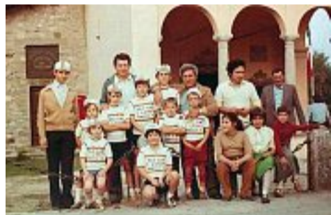
La Velo Sport Robecco negli anni Ottanta

● Oggi alle 18 inaugurazione della mostra «Ciclismo che passione» alla biblioteca comunale di Robecco sul Naviglio (Mi). È un'iniziativa inserita nel programma delle manifestazioni della 106ª edizione della Fiera di San Majolo e in quelle collaterali per la 18ª tappa del 24 maggio del prossimo Giro d'Italia, Abbiategrasso-Prato Nevoso. La mostra resterà aperta fino al 27 maggio da lunedì al sabato dalle 15 alle 18, domenica e festivi dalle 9.30 alle 12.30 e dalle 15 alle 18, il 1º maggio dalle 9 alle 18.